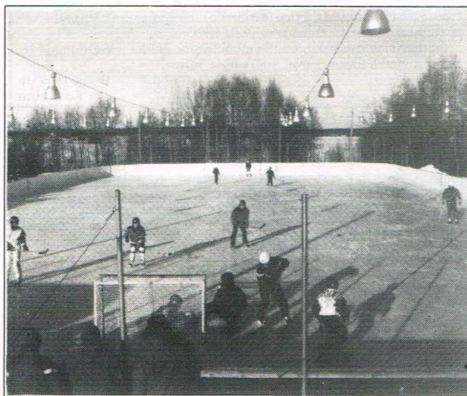
Kovaa peliä Pääntäläs

Pääntäneen uudessa jääkiekkokaukalossa pelattiin täydellä teholla, niin kauan kuin talvea riitti. Luistelijoita kyllä riitti, sillä luisteluharrastus valtasi Pääntäneläiset nuoret ja myös vanhemmatkin.